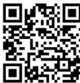
Рисунок 6 — Рекомендации по проведению кинопоказов в профилактике

Среди фильмов по тематике противодействия терроризму можно использовать следующие фильмы: «Беслан. Память» (Россия, 2014 г., возрастное ограничение: 12+), «Кавказский пленник» (Россия, 1996 г., возрастное ограничение: 18+), «Я не террорист» (Узбекистан, 2021 г., возрастное ограничение: 18+), «Отель Мумбаи: противостояние» (США, Австралия, 2018 г., возрастное ограничение: 18+) и т.д.