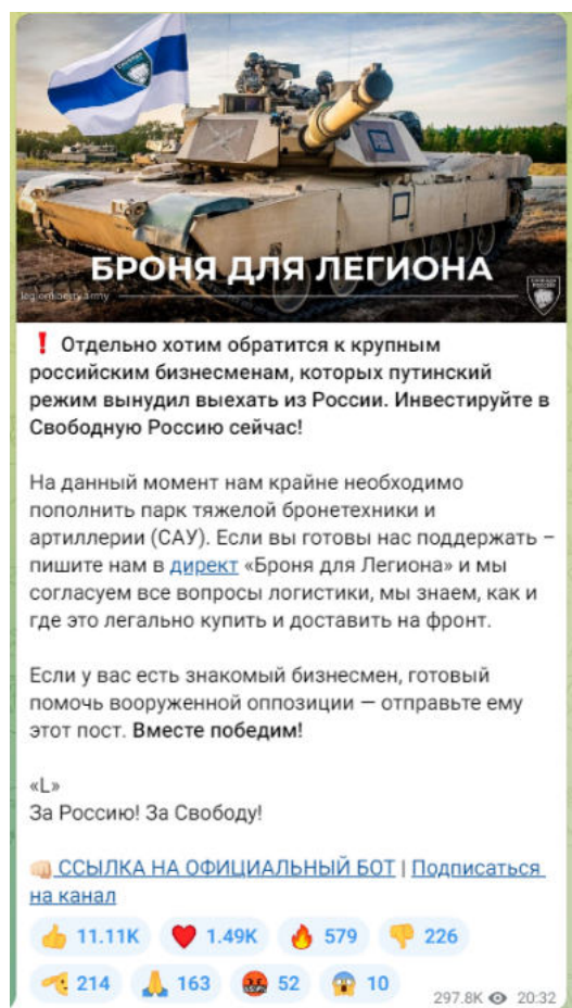
Рисунок 3 — Скриншот телеграм-канала легиона «Свобода России» с призывом к финансированию

Важно подчеркнуть, что помимо собственно пропаганды и распространения идеологии террористических организаций, а также вовлечения в деятельность террористических организаций существует еще одна угроза террористического характера — ложные сообщения о готовящемся террористическом акте. Только за 2021 год зафиксировано более 4,5 тысяч ложных сообщений о готовящихся терактах на объектах социальной инфраструктуры. Это может быть хулиганство, злой умысел, специфическое чувство юмора, желание проверить качество работы правоохранительных органов или антитеррористическую защищенность объекта и др. Во всех вышеперечисленных случаях за такой поступок придется нести уголовную ответственность. Ведь злоумышленник нарушает конструктивную деятельность общественных объектов, а правоохранителям приходится задействовать множество средств и сил, чтобы проверить объекты, которые якобы находятся под угрозой. За ложное сообщение о готовящемся теракте правонарушитель может быть наказан либо штрафами – от 200 тысяч рублей и до двух миллионов рублей, либо лишением свободы – от одного года до 10 лет. Ответственность за данный вид правонарушения наступает с 14 лет (статья 207 УК РФ «Заведомо ложное сообщение о акте терроризма»).