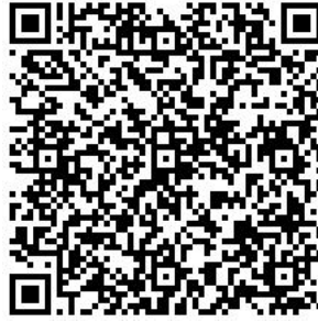
Рисунок 7 — Сценарий тематической викторины с примерами вопросов

В каждом из перечисленных мероприятий важно отслеживать активность участников, высказываемыми ими мнения, их настрой в целом. На таких мероприятиях необходимо присутствие психолога для фиксации активности и оценки их поведения.