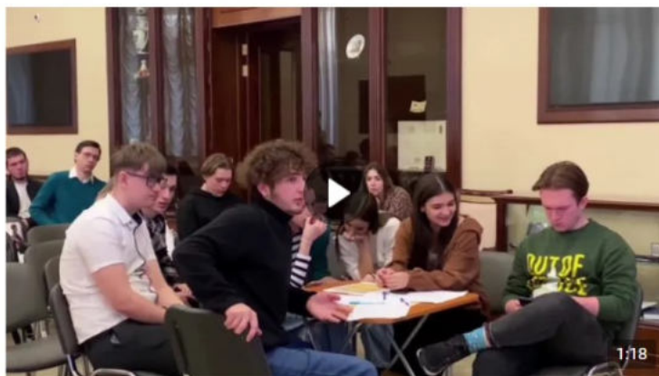
Дебаты «Идеология радикальных организаций» 1 888 просмотров

В рамках дебатов можно: развенчивать мифы, декларируемые представителями радикальных идеологий для вербовки; развивать навыки критического мышления и ведения дискуссии; формировать в целом антитеррористическое сознание и активную гражданскую позицию. Рекомендуется для мероприятия вовлекать не более 20 человек (см. рисунок 5).